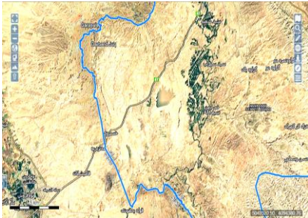
(نقشه موقعیت پروژه)