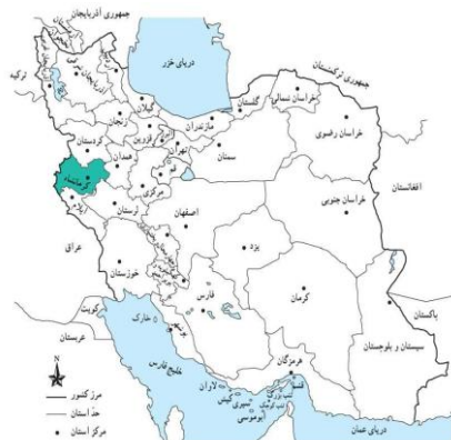
(نقشه موقعیت استان در کشور)