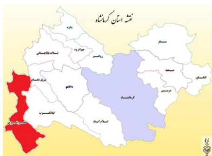
(نقشه موقعیت شهرستان در استان)